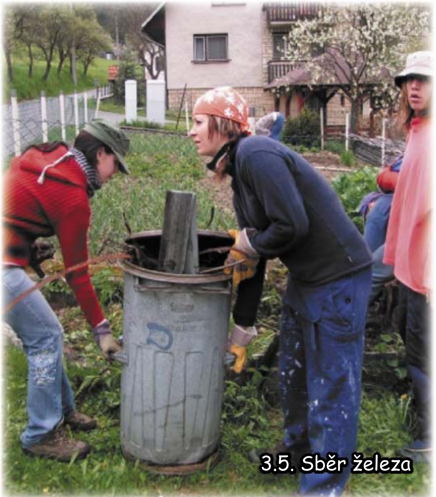
3.5. Sběr železa

Oddílový časopis 6.koeukovaného oddílu Junáka - svazu skautů a skautek ČR v Kateřinách číslo 95. vydáno 1. června, nákladem 40 výtisků